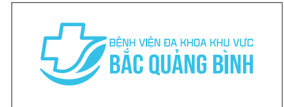
Logo trên nền nhận diện