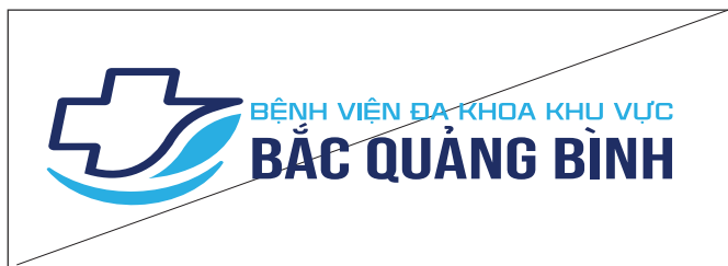
6. Không được bóp dẹt, làm dị dạng logo