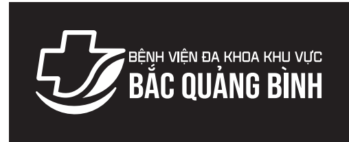
Logo âm bản

Logo có thể hiển thị dạng màu đơn sắc theo tông màu nhận diện