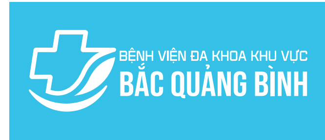
Logo dạng âm bản trên nền nhận diện