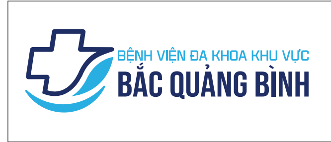
Logo định dạng nguyên bản

Tuyệt đối không vi phạm các dạng thức sử dụng logo sai như đã quy định, nếu có các trường hợp đặc biệt khác cần tham khảo thêm và được thông qua ý kiến của Ban thương hiệu trước khi tiến hành sử dụng.