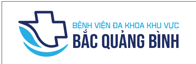
5. Không được thiết kế lại logo

Vui lòng sử dụng các tài liệu được cung cấp bởi Ban thương hiệu Bệnh viện đa khoa khu vực Bắc Quảng Bình để tránh được những sai sót và đảm bảo được tính đồng bộ, nhất quán, chính xác cho thương hiệu.