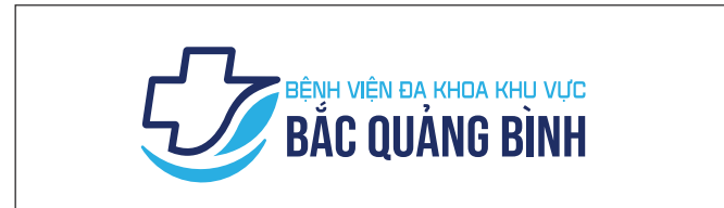
8. Không được bóp ngang logo