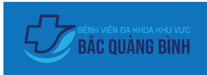
10. Không được đặt logo lên nền cùng màu với logo, trong trường hợp này cần chuyển về định dạng trắng