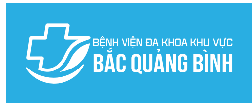
Logo trên nền nhận diện