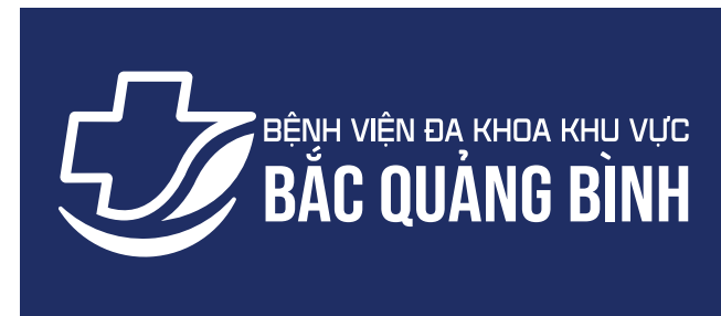
Logo dạng âm bản trên nền nhận diện