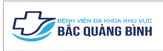
7. Không được xô nghiêng logo